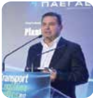
Κιούσης Δημήτρης Διευθύνων Σύμβουλος KIOUSSIS TRANSYS, Πρόεδρος ΠΕΕΔ

Ο Απόστολος Κεβανίδης είναι ο Πρόεδρος της Ομοσπονδίας Φορτηγών Αυτ/τών Ελλάδος από το 2008 έως σήμερα. Ξεκίνησε τις σπουδές του και τα πρώτα του επαγγελματικά βήματα ως Ηλεκτρολόγος Εργοδότης, από το 1990 όμως κι έπειτα ασχολείται ενεργά με τον χώρο του επαγγελματικού οχήματος. Έχοντας αποκτήσει πολύτιμη εμπειρία ως επαγγελματίας στον κλάδο των οδικών μεταφορών, εδώ και 20 χρόνια διατηρεί δική του εταιρία διεθνών οδικών εμπορευματικών μεταφορών. Η ενασχόληση του με τα κοινά είναι επίσης πολυετής, και γνωρίζοντας ως επαγγελματίας τις πραγματικές ανάγκες του σύγχρονου Έλληνα αυτοκινητιστή, ανέλαβε Πρόεδρος της ΟΦΑΕ με την δέσμευση να συμβάλλει ενεργά στον εκσυγχρονισμό του επαγγέλματος και την ανάδειξη του ρόλου του ως αναπόσπαστο κρίκο της Εφοδιαστικής Αλυσίδας.